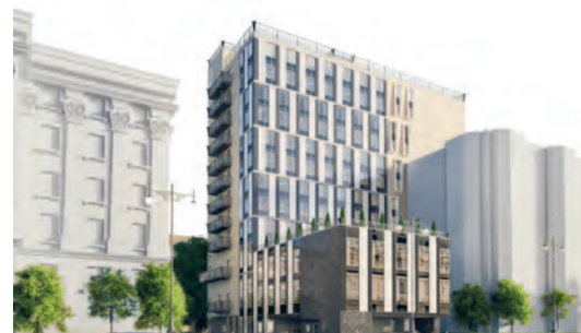
Комплекс апартментов Vertical на Московском проспекте в Петербурге.

В чем «фишка»? Используя знание местного рынка, а также технологии и ресурсы Всемирной сети, NAI Bescar предоставляет клиентам всю линейку услуг на рынке недвижимости по единым международным стандартам. Интегрированность в работу NAI Global дает возможность привлекать для каждого проекта лучших специалистов со всего мира. Гибкость системы NAI позволяет быстро находить эффективные и профессиональные решения.